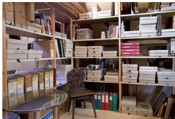
Archiv in der Kulturschüür Liebegg

Unser Archiv umfasst eine riesige Anzahl von Büchern, Broschüren, Dokumenten, Bildern, Fotos und Zeitungsausschnitten zur Geschichte Männedorfs und der Schifffahrt auf dem Zürichsee. Archiv und Fundus sind digital erfasst und stehen interessierten Kreisen zur Verfügung. Der Zugang erfolgt über unsere Homepage www.kulturschuer.ch