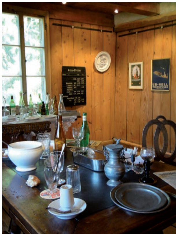
Ausstellung "De Leue und anderi Beize"

Jedes Jahr gestalten wir eine eigene Ausstellung in der lokale, regionale oder Themen aus der Zürichsee-Schifffahrt zum Zuge kommen. Basis ist unsere an zwei externen Orten gelagerte ortsgeschichtliche Sammlung und das Archiv.