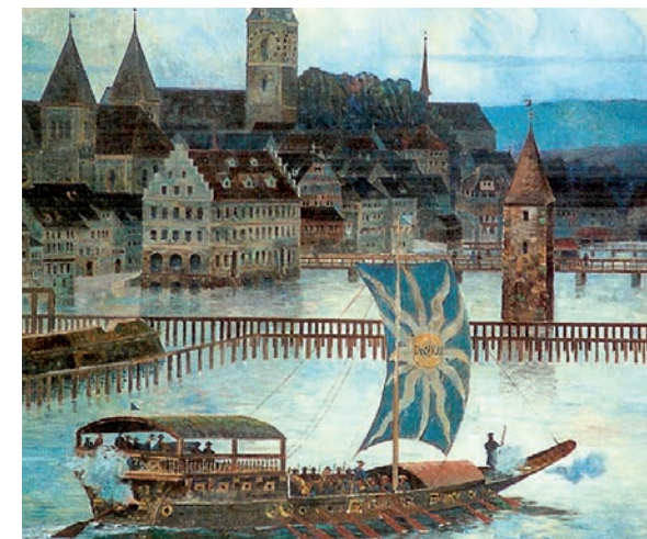
Kriegs- und Staatsschiff Neptun gebaut 1656

Die Schifffahrt findet man als virtuelle Ausstellung auf unserer Homepage. Sie wird laufend ausgebaut und zeigt die Geschichte der Schifffahrt auf dem Zürichsee. Basis ist unser Archiv.